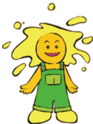
公社イメージキャラクター 『ほっほ』