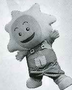
福祉サービス公社 公認キャラクター 「ぼっぼちゃん」