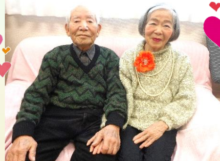
誕生日の記念に ご主人とツーショット！