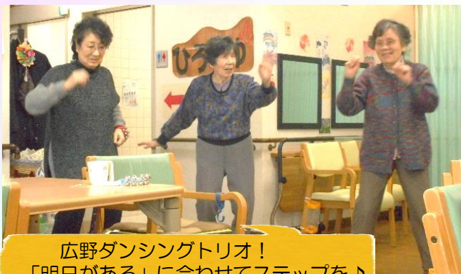
広野ダンシングトリオ！ 「明日がある」に合わせてステップを♪