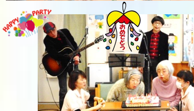
ライブの中で、お誕生日会をしました！ 皆でハッピーバースデー♪を歌ってお祝い♡