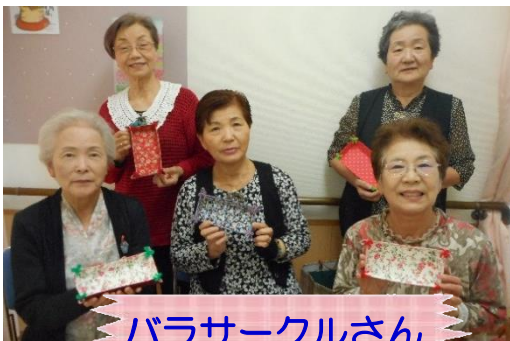
バラサークルさん

10月も地域の方が小物作りを教えに来て下さいました。今回は牛乳パックを使ったトレイです