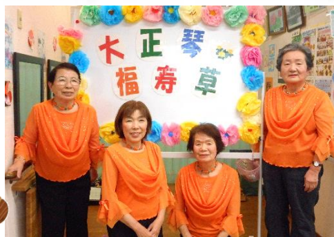
大正琴福寿草 (10月23日)