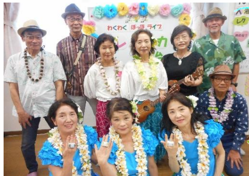
メレ・マカナ宇治 (10月24日)