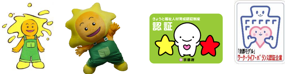
イメージキャラクター「ぼっぼ」